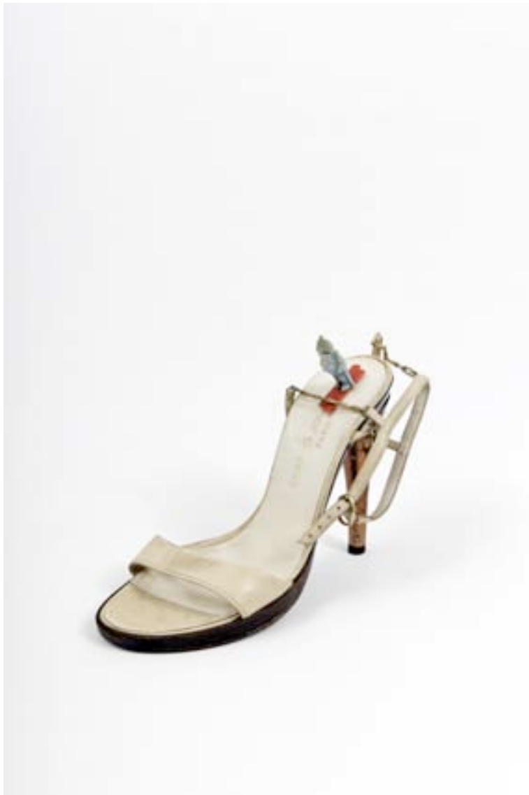
Présence Panchounette Saint-Moritz, 1988 Soulier Jourdan et figure en plastique 16 x 20 x 9 cm pièce unique N° Inv. PP-88-002