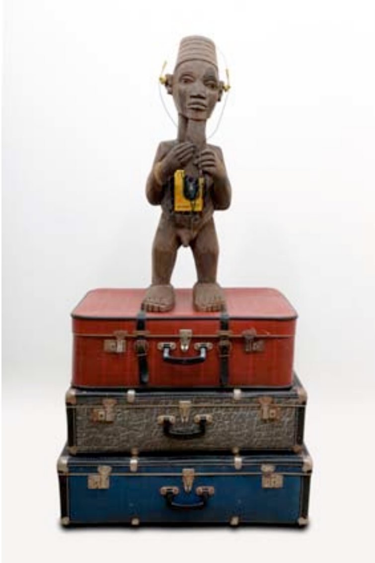
Présence Panchounette Bateke (walkman), 1985 Statue en bois exotique, grillage, walkman et valises 158 x 80 x 55 cm pièce unique N° Inv. PP-85-003