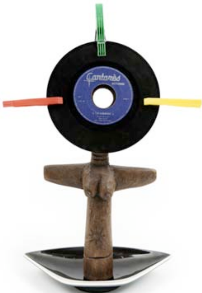
Présence Panchounette Ashanti de faire votre connaissance, 1985 Statue en bois exotique, cendrier en faïence, disque vinyl 45tr (la création du père Kodjo) et pince 44 x 30 x 10 cm pièce unique N° Inv. PP-85-001