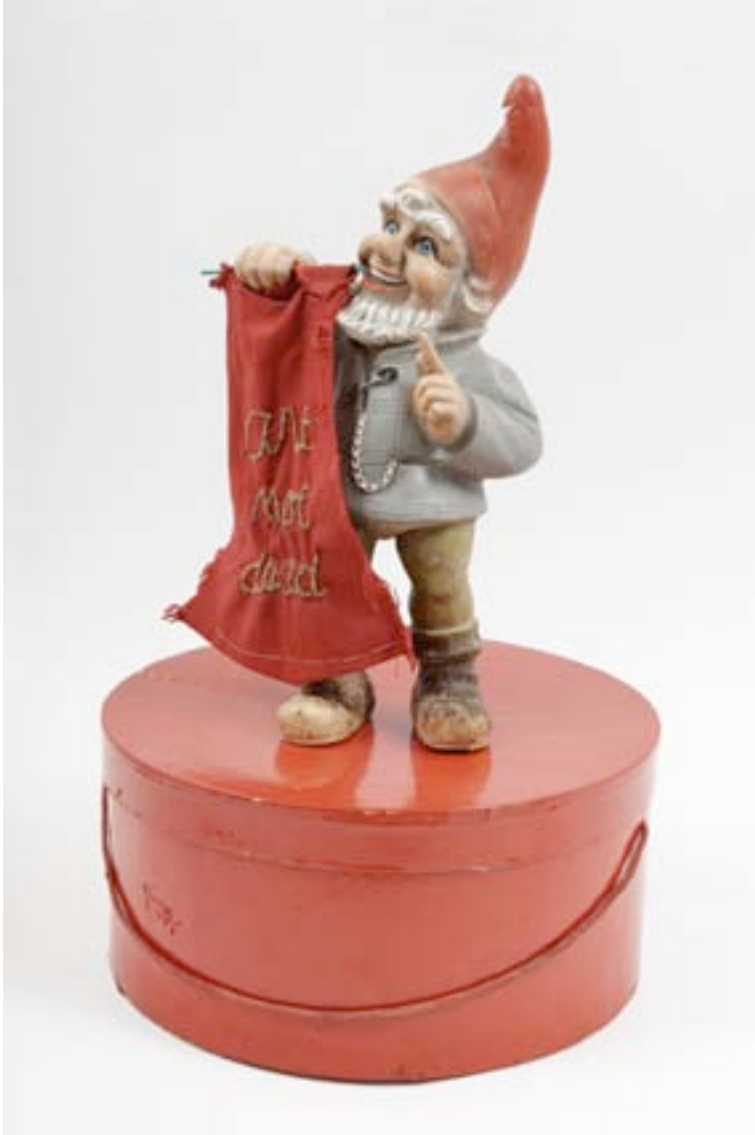
Présence Panchounette Art not dead, 1989 Nain en plastique, tissu brodé et boîte à chapeau peinte 51x 32 (diam.) cm pièce unique N° Inv. PP-89-001