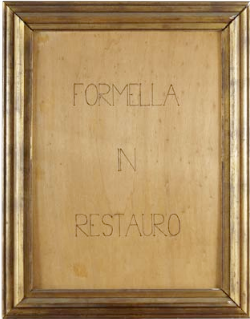
Présence Panchounette Formella in restauro 1, 1988 Cadre et feutre sur bois pièce unique N° Inv. PP-88-003